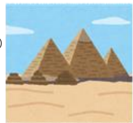
ピラミッド(エジプト)