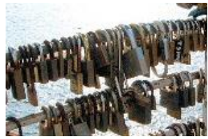
あい なんきんじょう 愛の南京錠