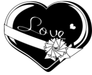
バレンタインデー