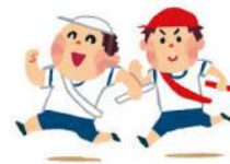
うんどうかい 運動会