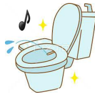
せんじょうきのうつ べんぎ 洗浄機能付き便座