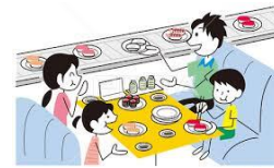
かいてん 回転ずし