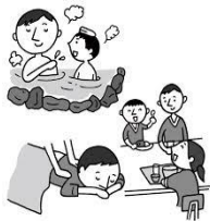
せんとう スーパー銭湯