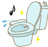
せんじょうきのうつ べんざ 洗浄機能付き便座