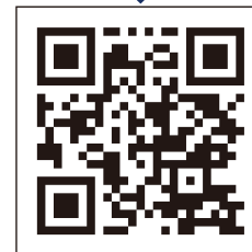
「コロナワクチンナビ」 二次元コード