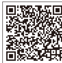
「吹田市新型コロナ ワクチン予約サイト」

予約サイトへは、右の「QR コード」をご利用いただくか、 検索サイトで「吹田市新型コロナ ワクチン予約サイト」と入 力し吹田市のホームページに アクセスしてください。