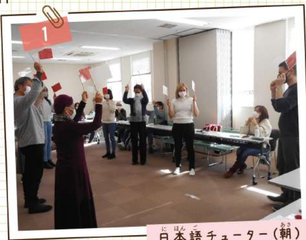
日本語チューター(朝)