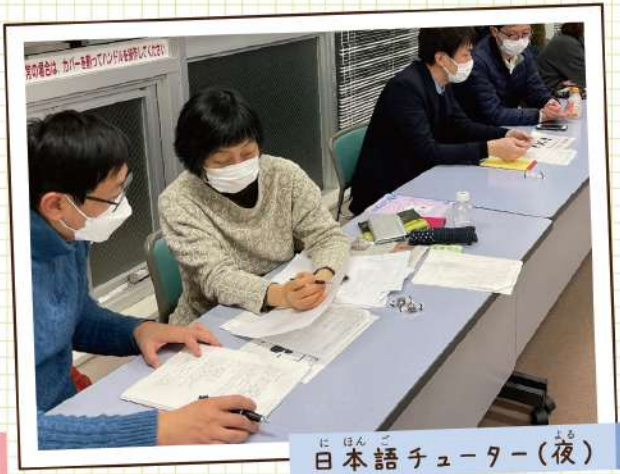
日本語チューター(夜)