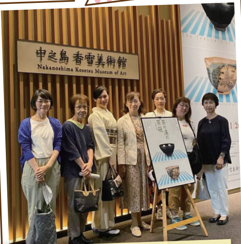
昨年秋の和ごころ研修で茶道具展を見に行きました！